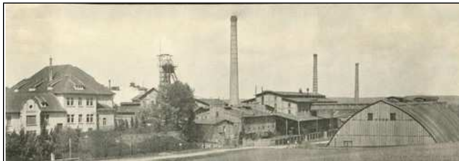
Foto des Geländes aus dem Jahr 1910

Bereits wenig später begann eine zunehmende Verlagerung der Abbautätigkeit in Richtung Morsleben, dessen Schacht im Jahr 1912 fertiggestellt wurde. Die Kali und Steinsalze wurden weiterhin in der Fabrik in Beendorf aufbereitet. Nach zwischenzeitlichen Produktionsunterbrechungen